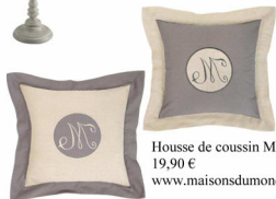
Housse de coussin Montaigne gris 19,90 € www.maisonsdumonde.com