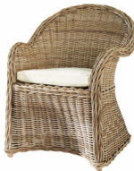
Fauteuil KEY WEST 199 € www.maisonsdumonde.com