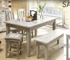
Salle à manger RIVIERA Table 160 x 90 + allonge 50 : 358 € Chaise 89 € Tabouret de bar 69 € www.cocktail-scandinave.fr