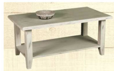
Salle basse RIVIERA Table 100 x 55 cm 219 €