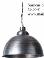
Suspension factory 69,90 € www.maisonsdumonde.com