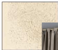
ficelle + cire poussière de dune