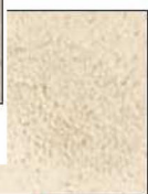
ficelle + cire poussière de dune