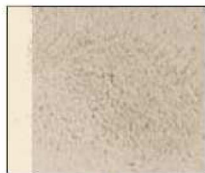
ficelle + cire pierre naturelle