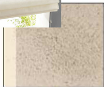
ficelle + cire pierre naturelle

Pour un décor naturel en harmonie avec la teinte saumonée de la cuisine et du carrelage, choisissez de rester dans des aspects minéraux pour les murs avec des teintes neutres qui souligneront le beige de la pierre et le gris des canapés.