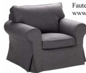
Canapé EKTORP 175 x 88 cm Housse Svanby gris (déhoussable) 459 € Fauteuil 329 € www.ikea.com